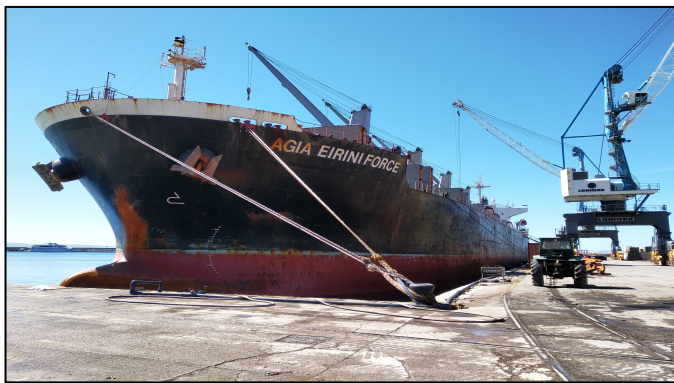
Trasporto merci via mare al porto di Rijeka

marittimo, che reputo un lavoro molto attivo in quanto c'è continuo movimento. La cosa più interessante dal mio punto di vista è la possibilità di non restare in ufficio tutto il tempo, bensì di visitare porti e cantieri navali incontrando molte persone, rendendo così il lavoro sempre stimolante e mai noioso”.