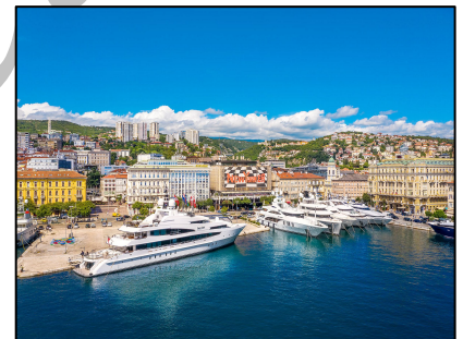
Città di Rijeka (Croazia)

solutions and services), progetto strategico del programma di cooperazione transfrontaliera Interreg VA Italia-Croazia CBC , che si pone l'obiettivo di migliorare l'offerta di soluzioni e servizi di trasporto multimodale sostenibile per i passeggeri delle regioni adriatiche italiane e croate coinvolte nel programma.