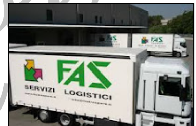
FAS SRL, azienda teatina specializzata in logistica integrata e trasporto via terra, aria e mare