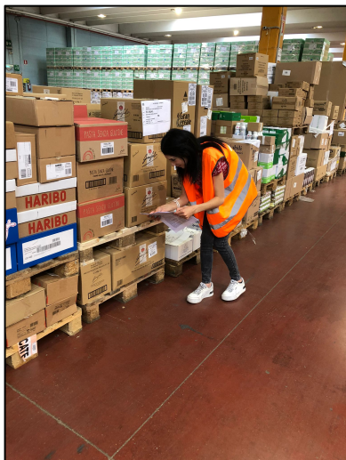
Controllo delle etichette