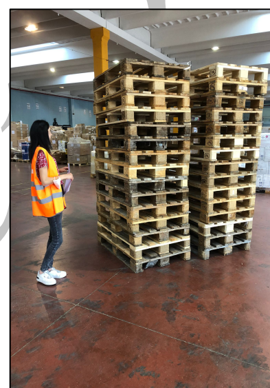
Controllo dei pallets

interessante vedere in maniera pratica gli argomenti già trattati in classe. Inoltre mi sono subito sentita parte integrante del team lavorativo: c'è un bel clima di collaborazione!"