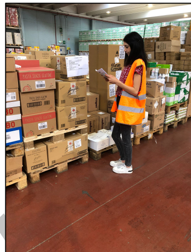
Controllo della merce