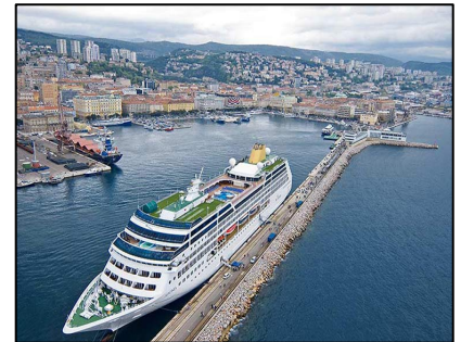
Porto di Rijeka (Croazia)

GLI APPROFONDIMENTI E LE ALTRE FOTO SONO CONSULTABILI SUL SITO WWW.ITSMOST.IT E SUI NOSTRI PROFILI SOCIAL