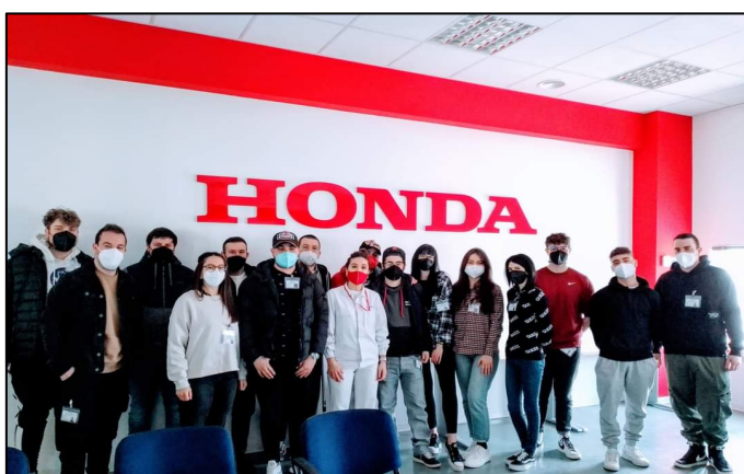
Gli allievi del 2°ANNO durante i laboratori tematici presso la sede di Atesa

GLI APPROFONDIMENTI E LE ALTRE FOTO SONO CONSULTABILI SUL SITO WWW.ITSMOST.IT E SUI NOSTRI PROFILI SOCIAL