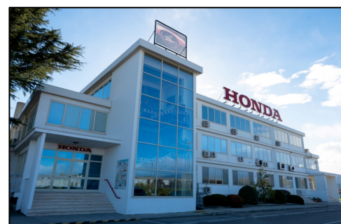
Lo stabilimento Honda di Atesa (CH)

L'obiettivo è quello di fornire prodotti di elevata qualità ad un prezzo accessibile, utilizzando le tecnologie più all'avanguardia . Presente in 28 Paesi , lo stabilimento produttivo di Atesa (Honda Italia Industriale S.p.A.) è il sito manifatturiero di riferimento per le due ruote in Europa ... PER APPROFONDIMENTI VISITA IL SITO www.itsmost.it