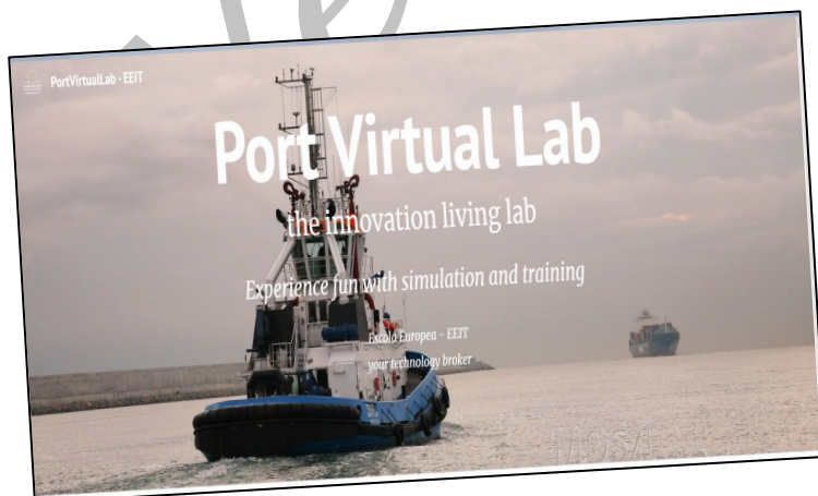
Piattaforma Port Virtual Lab sviluppata dalla Escuela Europea