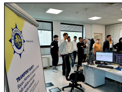
LTRANSPORT S.p.a una delle maggiori realtà europee nel campo del trasporto e della logistica

Oltre ad esplorare gli espositori del LetExpo e sfruttare le migliori occasioni di job seeking , gli allievi dell'ITS MO.ST hanno avuto la possibilità visitare le sedi di alcune realtà aziendali leader di settore in Italia, quali il CONEROBUS , società per la mobilità intercomunale di Ancona, l'Interporto QUADRANTE EUROPA di Verona , la "città delle merci" più grande d'Italia, e infine la filiale piacentina