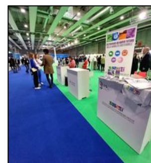
Stand ITS MO.ST presso LetExpo di Verona

Infine, gli allievi hanno avuto l'occasione di visitare l'Aeroporto Internazionale d'Abruzzo di Pescara . La giornata è stata dedicata alla logistica aeroportuale e alla conoscenza della struttura e delle attività svolte all'interno del terminal. Grazie alla collaborazione con la SAGA, società che gestisce l'aeroporto abruzzese che ha curato la visita, i nostri allievi hanno potuto conoscere in prima persona le principali attività per il controllo passeggeri (safety e security) e per il controllo doganale nel trasporto merci.