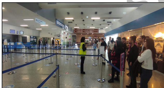
Colloquio con SAGA, società che gestisce l'aeroporto abruzzese