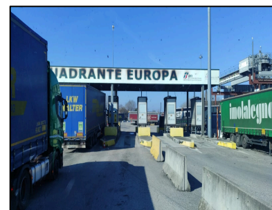
Interporto QUADRANTE EUROPA di Verona

Oltre ad esplorare gli espositori del LetExpo e sfruttare le migliori occasioni di job seeking , gli allievi dell'ITS MO.ST hanno avuto la possibilità visitare le sedi di alcune realtà aziendali leader di settore in Italia, quali il CONEROBUS , società per la mobilità intercomunale di Ancona, l'Interporto QUADRANTE EUROPA di Verona , la "città delle merci" più grande d'Italia, e infine la filiale piacentina