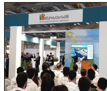
Incontro conoscitivo con l'azienda INTERMODALTRASPORTI

Gli allievi dell'ITS MO.ST hanno vissuto da protagonisti le giornate di fiera, coinvolti in conferenze, workshop, laboratori e demo con le principali aziende di settore, cogliendo opportunità stimolanti per la loro formazione e il loro futuro professionale .