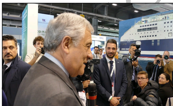
Anche il ministro degli Esteri Antonio Tajani presente all'incontro con Grimaldi Lines