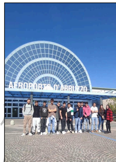
Aeroporto Internazionale d'Abruzzo di Pescara

I responsabili aziendali hanno raccontato ai ragazzi la storia di Ingvar Kamprad , fondatore di IKEA , e di come la sua piccola attività di vendita sia diventata un marchio globale di arredamento capace di coniugare design e comfort a prezzi accessibili. La visione di IKEA è infatti quella di migliorare la vita quotidiana dei suoi clienti, sempre nell'ottica della sostenibilità ambientale e sociale.