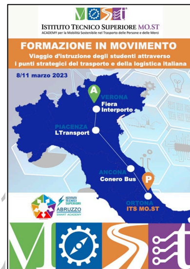
Si rinnova l'appuntamento con Formazione in movimento

Giornate ricche di appuntamenti quelle vissute dagli allievi del 2° ANNO dell'ITS MO.ST, i quali sono stati impegnati nel visitare diverse aziende e realtà del territorio abruzzese . Il primo incontro si è svolto presso la sede BRT S.p.A. di San Giovanni Teatino (CH) , dove gli studenti sono stati accolti dai responsabili della filiale. Una collaborazione , quella con BRT, che si rinnova ogni anno: l'azienda infatti ospita i nostri allievi durante il tirocinio curriculare già da 2 anni e, molto spesso al termine delle attività curricolari, ai tirocinanti viene chiesto di restare in azienda per continuare il rapporto di lavoro... PER APPROFONDIMENTI VISITA IL SITO www.itsmost.it