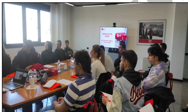
Visita presso la sede BRT S.p.A. di San Giovanni Teatino (CH)

Giornate ricche di appuntamenti quelle vissute dagli allievi del 2° ANNO dell'ITS MO.ST, i quali sono stati impegnati nel visitare diverse aziende e realtà del territorio abruzzese.