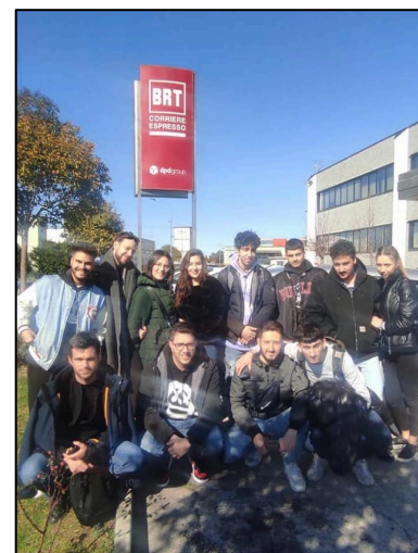
L'incontro svolto presso la sede BRT S.p.A. di San Giovanni Teatino (CH)