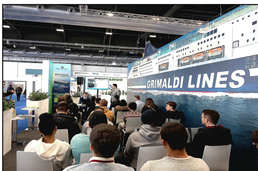
Gli Allievi dell'ITS MO.ST conoscono il mondo GRIMALDI LINES

Altra tappa interessante è stato l'incontro con GRIMALDI LINES , finalizzato a conoscere da vicino la storia, le figure professionali di bordo, i progetti di turismo accessibile e le tematiche green promosse dalla nota compagnia di navigazione.