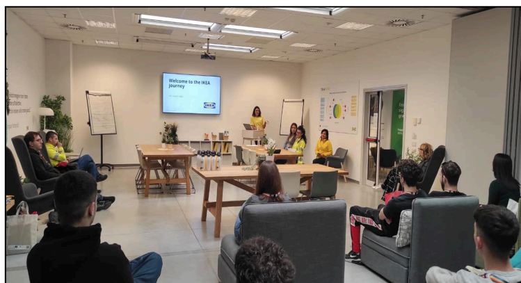
Appuntamento con i responsabili IKEA di San Giovanni Teatino (CH)

I responsabili aziendali hanno raccontato ai ragazzi la storia di Ingvar Kamprad , fondatore di IKEA , e di come la sua piccola attività di vendita sia diventata un marchio globale di arredamento capace di coniugare design e comfort a prezzi accessibili. La visione di IKEA è infatti quella di migliorare la vita quotidiana dei suoi clienti, sempre nell'ottica della sostenibilità ambientale e sociale.