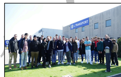
Gli Allievi ITS MO.ST alla filiale piacentina della LTRANSPORT S.p.a,

Il dibattito dell'edizione 2023 si è concentrato sul futuro della mobilità sostenibile, sulla smart mobility, nonché sulle nuove sfide di formazione, ricerca e sviluppo.