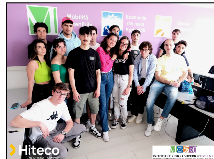
Gli Allievi al termine del laboratorio SAP curato da HITECO spa