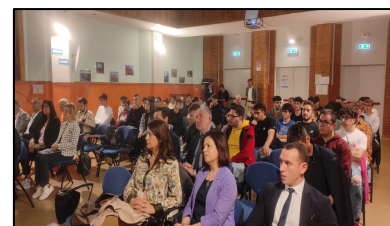
Gli ospiti presenti alla Premiazione