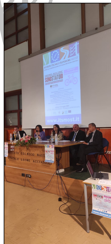
La premiazione si è tenuta nell'Aula Magna dell'I.I.S. "Acciaiuoli-Einaudi" di Ortona

Lo spot-video ideato dagli allievi nasce dall'osservazione della loro quotidianità: ogni giorno gli studenti prendono i mezzi pubblici per raggiungere la scuola e svolgere le loro attività assistendo così a fenomeni di vandalismo e maltrattamento degli stessi.