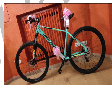
Il premio ricevuto: una scintillante mountain bike

Gli studenti, classificandosi al 1° posto della competizione, hanno ricevuto come premio una scintillante mountain bike consegnata direttamente dal Segretario Regionale Fit-Cisl Abruzzo, Amelio Angelucci il quale ha sottolineato l'importanza che questi messaggi positivi siano trasmessi dai giovani per i giovani.