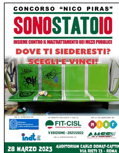
La locandina del concorso nazionale