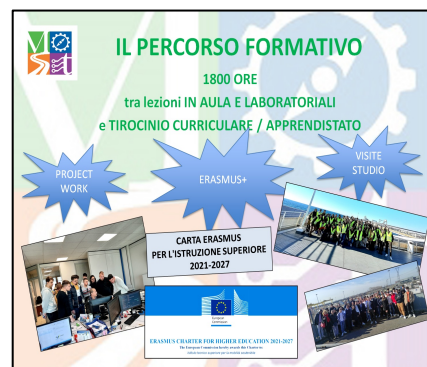
Il percorso formativo comprende lezioni in aula, laboratori e tirocinio