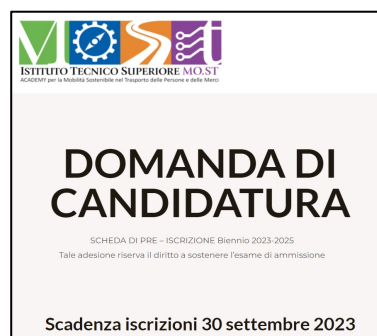
Il form d'iscrizione su www.itsmost.it