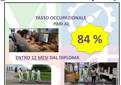
Il tasso occupazionale dei diplomati è pari all' 84%

Durante il biennio sono previste borse di studio ERASMUS+ , visite aziendali, realizzazione di case studies , nonché l’acquisizione di crediti formativi universitari e certificazioni (tra cui il Cambridge English , il certificato per la sicurezza sui luoghi di lavoro, l’attestato di abilitazione per carrellisti e certificati abilitativi per la gestione delle merci in porto).