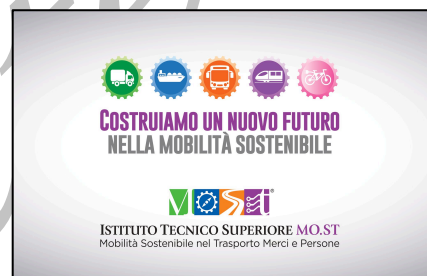
"Costruiamo un nuovo futuro nella mobilità sostenibile"