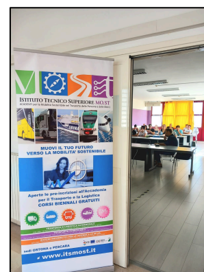
Clicca su www.itsmost.it e scopri le nostre attività

Entrambi hanno lavorato con grande spirito di volontà al progetto, si sono confrontati quotidianamente nella gestione operativa dei processi e sono stati di supporto toccando con