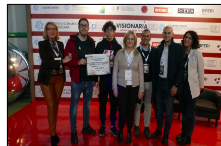
Storie di alternanza 2023: gli allievi con la Direttrice e i Tutor

Quest'anno, per la 32esima edizione di JOB&Orienta , Salone nazionale dedicato all'orientamento, alla scuola, alla formazione e al lavoro, i padiglioni di Veronafiere hanno ospitato un'ampia rassegna espositiva incentrata sull'orientamento made in Italy, focus tematico che quest'anno l'Europa ha voluto dedicare alle competenze. Il Salone JOB&Orienta è promosso da Veronafiere e Regione Veneto in collaborazione con Ministero dell'Istruzione e del Merito, Ministero del Lavoro e delle Politiche sociali e da quest'anno anche Ministero dell'Università e della Ricerca . Grande ruolo hanno da sempre le Regioni e Unioncamere, accanto a numerosi altri attori istituzionali e non solo... PER APPROFONDIMENTI VISITA IL SITO www.itsmost.it