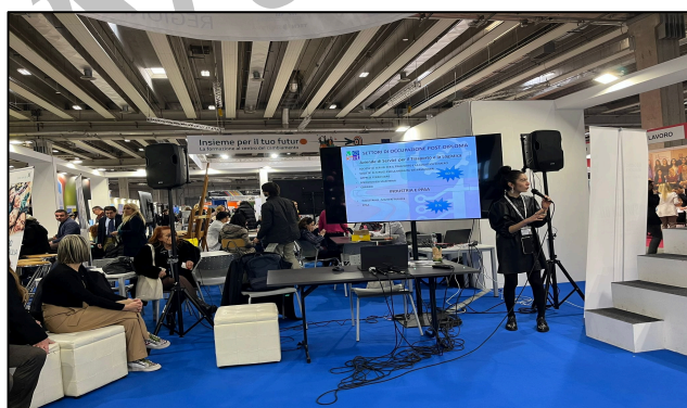
Job&Orienta 2023: l’ITS MO.ST presenta l’offerta formativa

Un’attenzione particolare come sempre è dedicata a valorizzare le esperienze di dialogo e collaborazione tra scuole e imprese, a raccontare i cambiamenti del mondo del lavoro, a far luce sulle competenze più richieste e le figure professionali più ricercate.