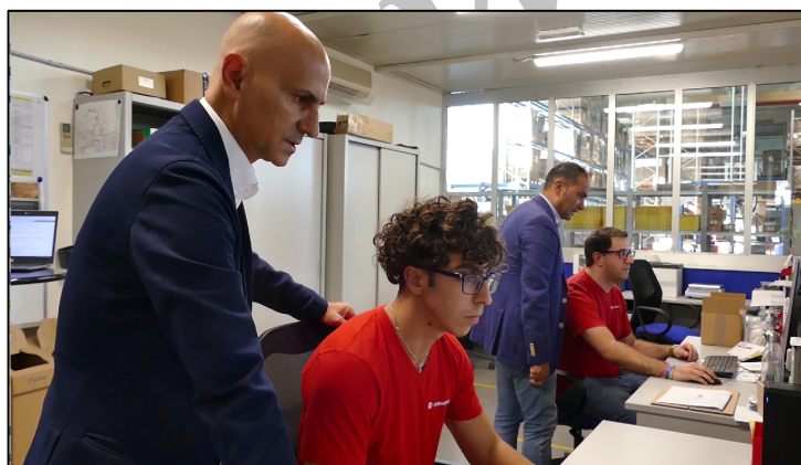
Gli allievi in azienda al lavoro sul progetto DIGITAL WAREHOUSE