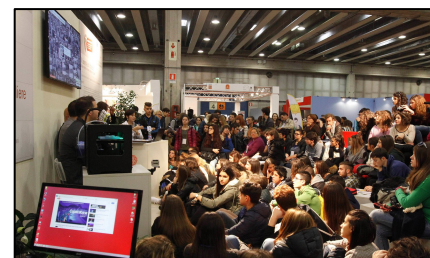
Job&Orienta 2023_workshop con gli studenti