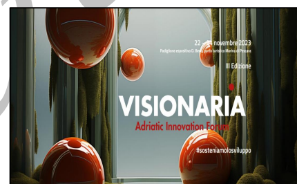
Storie di alternanza 2023_Il Forum VISIONARIA