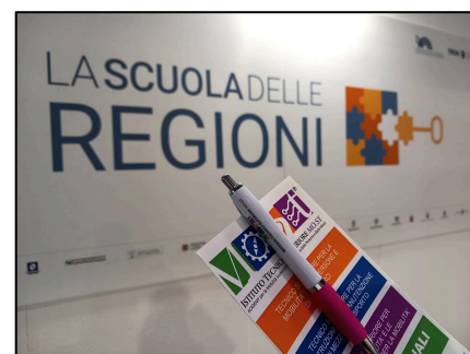
Al Job&Orienta 2023 la Scuola delle Regioni