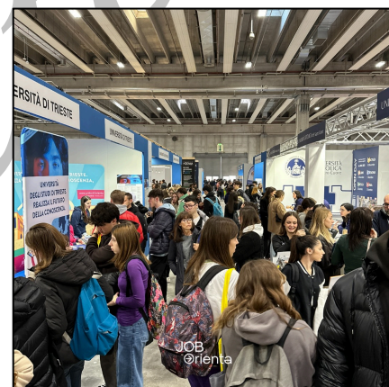
Job&Orienta 2023: studenti in visita nei padiglioni

La manifestazione rappresenta un’occasione di confronto e formazione per gli operatori del settore, poiché intende accompagnare i ragazzi e le loro famiglie nella scelta del percorso formativo, ma anche supportare i giovani che vogliono approfondire le proprie competenze o siano in cerca di occupazione.