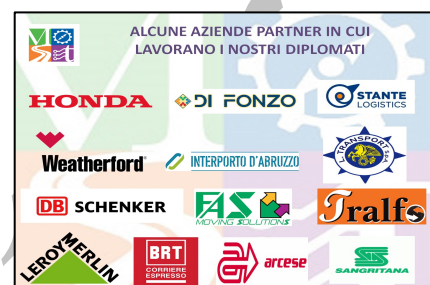
Alcune aziende partner dell'ITS MO.ST

Gli allievi, coadiuvati dai loro tutor aziendali, hanno così trasformato la normale operatività della logistica interna in un processo logistico basato sull'ottimizzazione dei flussi delle merci, sia in entrata sia in uscita, e su una allocazione dei materiali e dei servizi di packaging secondo la teoria scientifica di analisi "ABC".